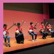
青森大学三味線部 あおしやみ

こだわりのあおもり産品をたっぷりレポートします！ 三味線や囃子のステージもご期待ください！