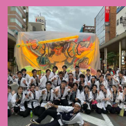
青森公立大学 ねぶた囃子サークル