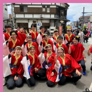
青森公立大学よこい サークル影飛威Sea